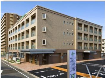
北名古屋西春医療介護施設群