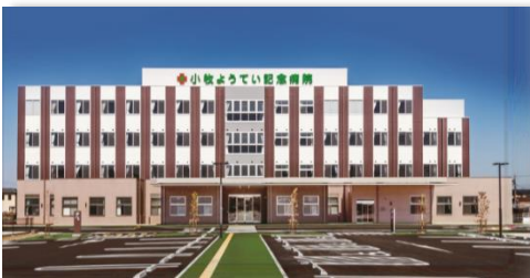
小牧ようてい記念病院