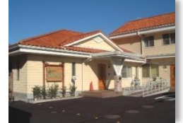
アネックス病棟(岩倉)