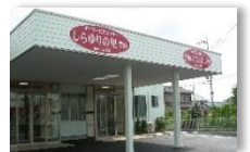
デイサービスセンター しらゆりの里豊山