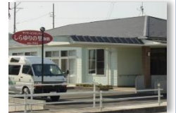
デイサービスセンター しらゆりの里師勝