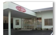
デイサービスセンター しらゆりの里九之坪