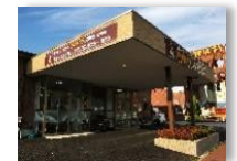
デイサービスセンター アクティブしらゆりもりやま