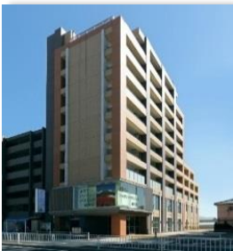
名古屋市藤が丘医療介護施設群