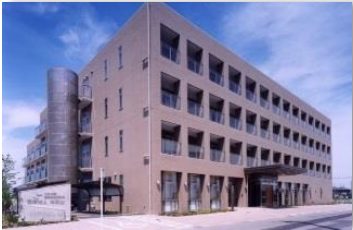
北名古屋師勝医療介護施設