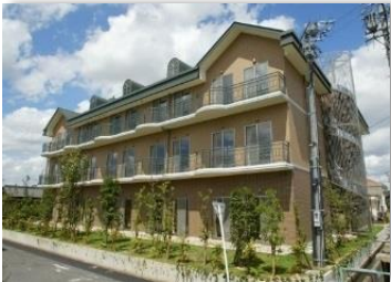
介護老人保健施設るどの泉(岩倉)