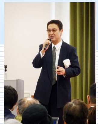
小牧ようてい記念病院 セミナー