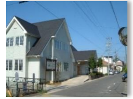
デイケアセンターしらゆりの里