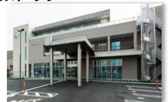
ようてい中央クリニック