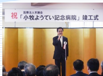
小牧ようてい記念病院 竣工式