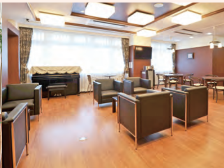
るんどホール(共有スペース)